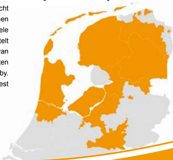
Het werkgebied van De Kraamvogel

De Kraamvogel levert kraamzorg in Noord- en Midden-Nederland. Het werkgebied strekt zich uit over de provincies Friesland, Drenthe, Flevoland, Noord-Holland en delen van Groningen, Overijssel, Utrecht en Gelderland. Onze kraamverzorgenden werken in kleinschalige teams, in nauwe samenwerking met verloskundigen. Dicht bij jou in de buurt. Kraamzorg van De Kraamvogel is vertrouwd en dichtbij.